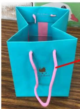
把手拆下丟一般垃圾。